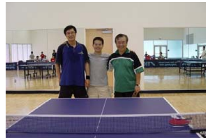
2007- TableTennis Tournament